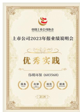
2023年业绩说明会优秀实践