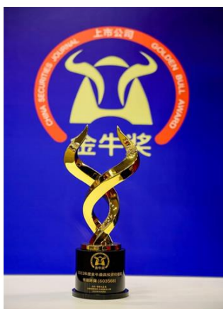
2023年度金牛最具投资者价值奖

报告期内，公司获得资本市场的广泛认可，入选中证 A500 指数成份股，荣获中国上市公司协会“上市公司 2023 年业绩说明会”优秀实践、中国证券报主办的第二十六届上市公司金牛奖之“2023 年度金牛最具投资价值奖”、证券时报主办的第十五届天马奖之“中国上市公司投资者关系管理天马奖”和第十八届中国上市公司价值评选之“ESG 百强奖”、证券市场周刊主办的第十八届资本市场水晶球奖评选之“最具投资价值上市公司奖”、《董事会》杂志第十九届中国上市公司董事会金圆桌奖之“优秀董事会”、证券之星主办的 2024 年资本力量年度评选之“优秀上市公司奖”和“ESG 新标杆企业奖”、浙江省企业社会责任促进会主办的“2023 浙江省企业社会责任标杆企业”等称号，并获得华证 ESG 评级“2023 年度环境、社会、公司治理（ESG）综合评级 A 级”。项光明董事长入选福布斯“2024 中国最佳 50 名 CEO”榜单，荣膺《董事会》杂志“最具战略眼光董事长奖”、证券市场周刊“最佳董事长奖”，充分体现了业界对公司管理层的肯定与认可。